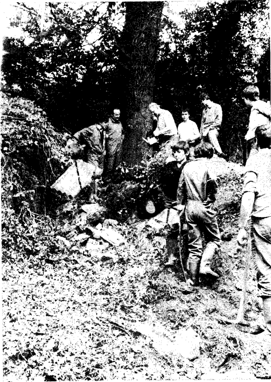
Le chantier au moulin de l'Abbaye de Boquen